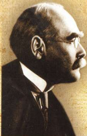
Joseph Rudyard Kipling (1865 – 1936)