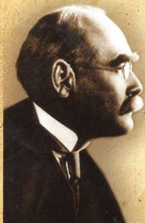
Joseph Rudyard Kipling (1865 – 1936)