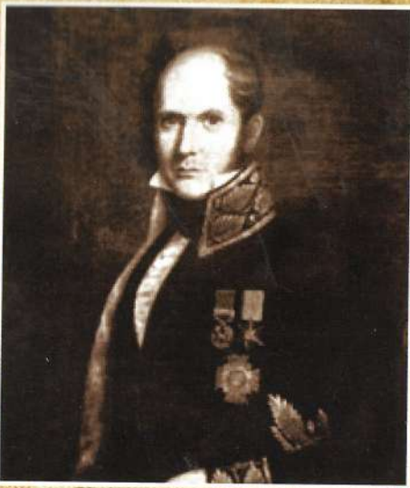
Sir William Henry Sleeman (1788 – 1856)