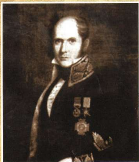
Sir William Henry Sleeman (1788 – 1856)